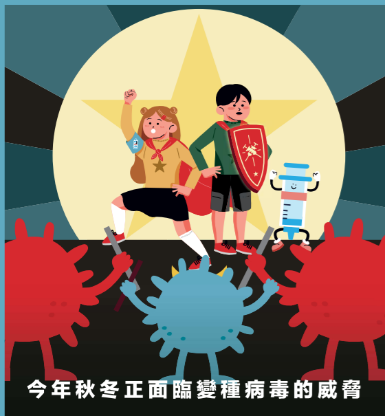
今年秋冬正面臨變種病毒的威脅