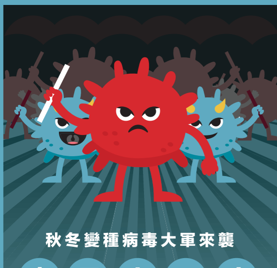
秋冬變種病毒大軍來襲